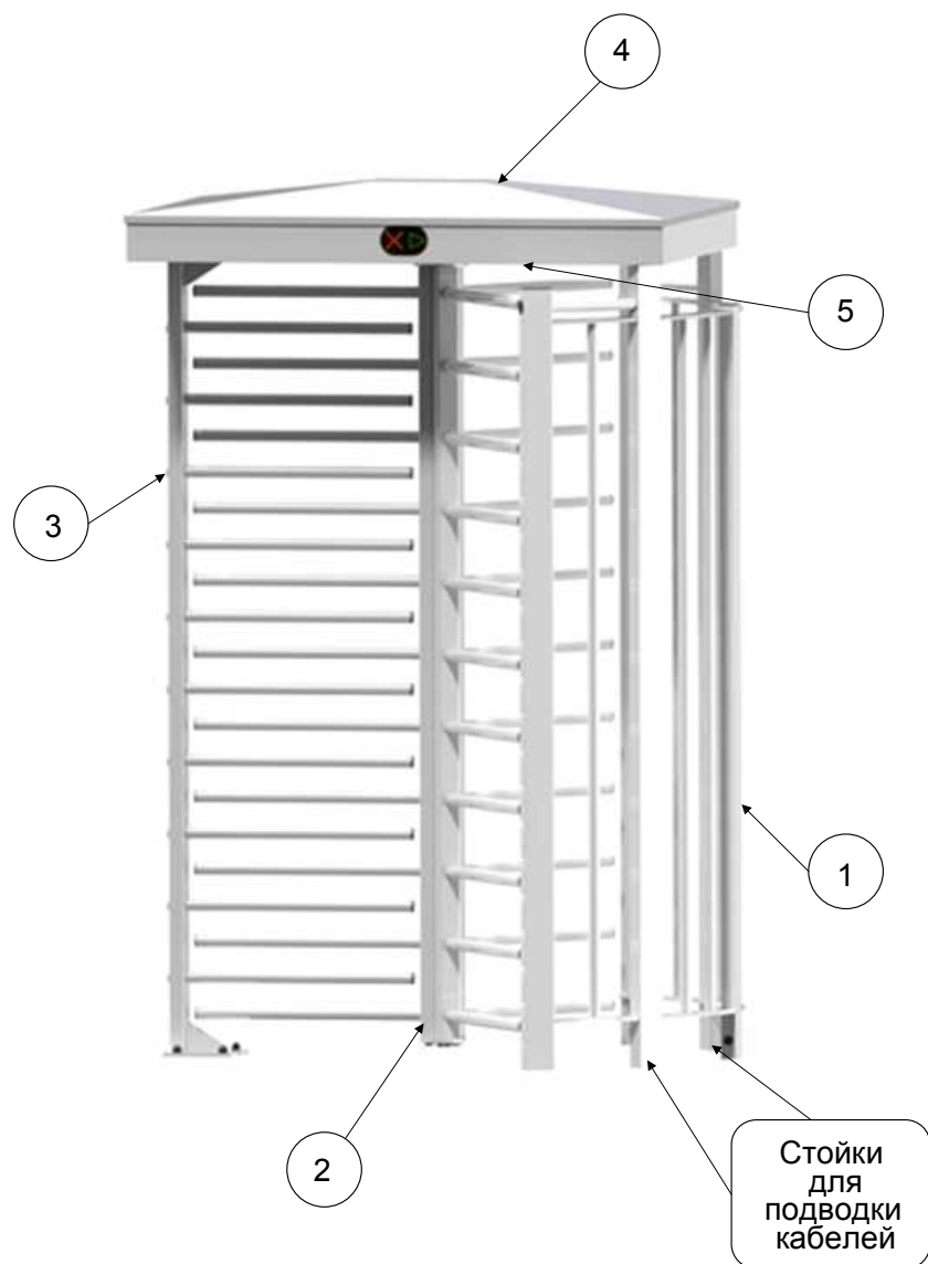
Рис. 1. Общий вид турникета.